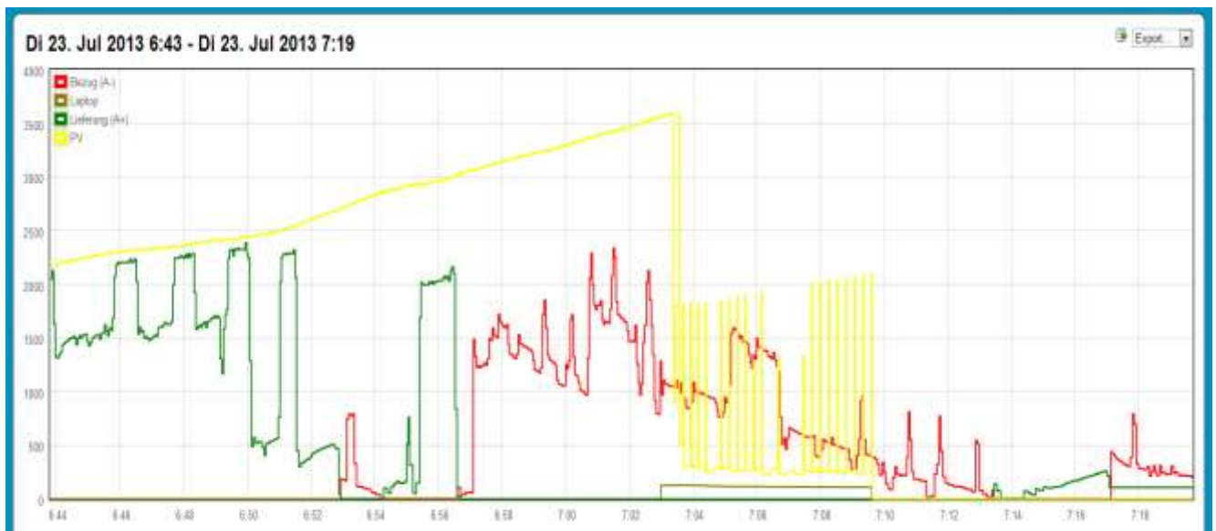
Bild 1: Impulszählung mit s0vz neue Version, Zählung versagt ab 3500kW.

Bezug + Lieferung → eHz über IR-Lesekopf an Erweiterung